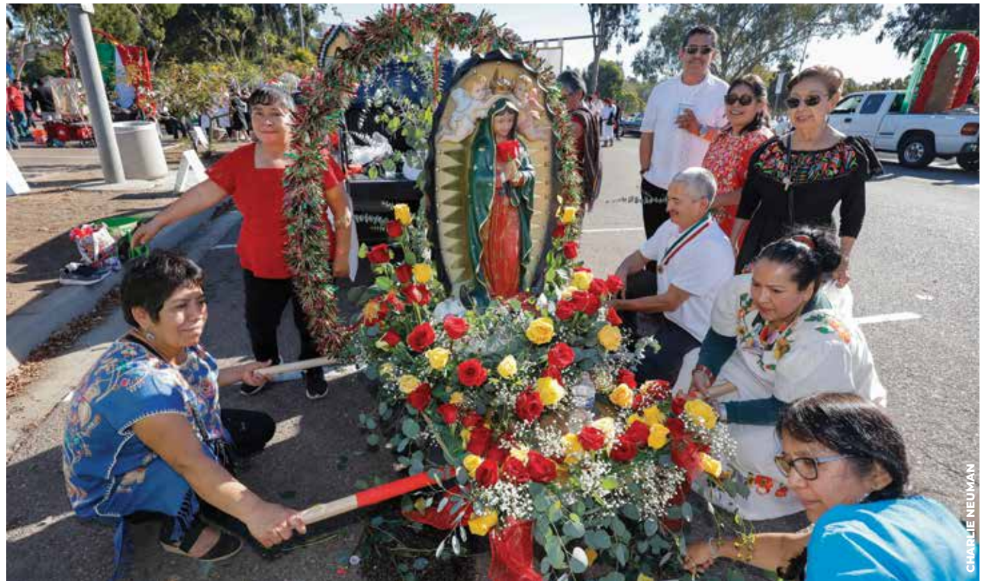
ESPECTÁCULO: Coloridas flores, vistosos vestuarios, música y alegría llenaron las calles de San Diego durante la Procesión de la Virgen de Guadalupe.

marylehillmft@gmail.com www.marylehillmft.com 1650 Linda Vista Dr. Ste. 210, San Marcos, CA 92078