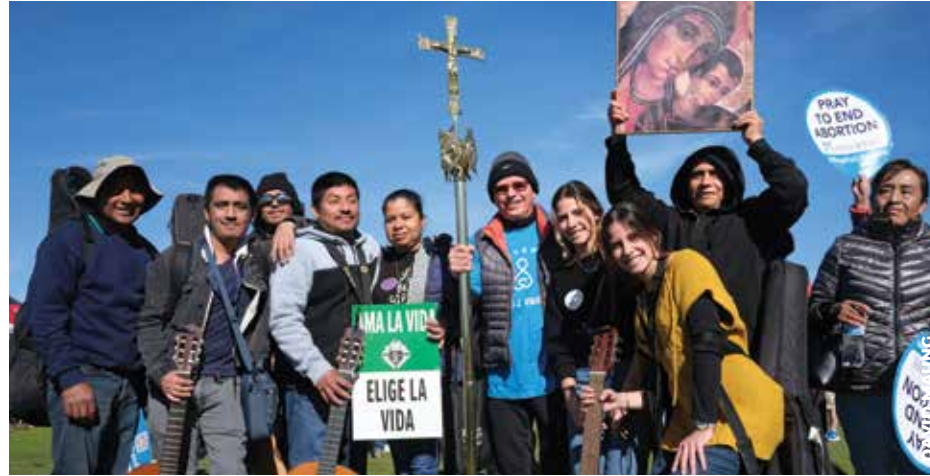
TESTIMONIO: Se espera que miles de personas se congreguen en el Waterfront Park el sábado 18 de enero para celebrar y defender la vida durante la 13ª edición anual de la Caminata por la Vida de San Diego.

Se espera que más de 3 mil personas asistan a la Caminata por la Vida, que se llevará a cabo el sábado 18 de