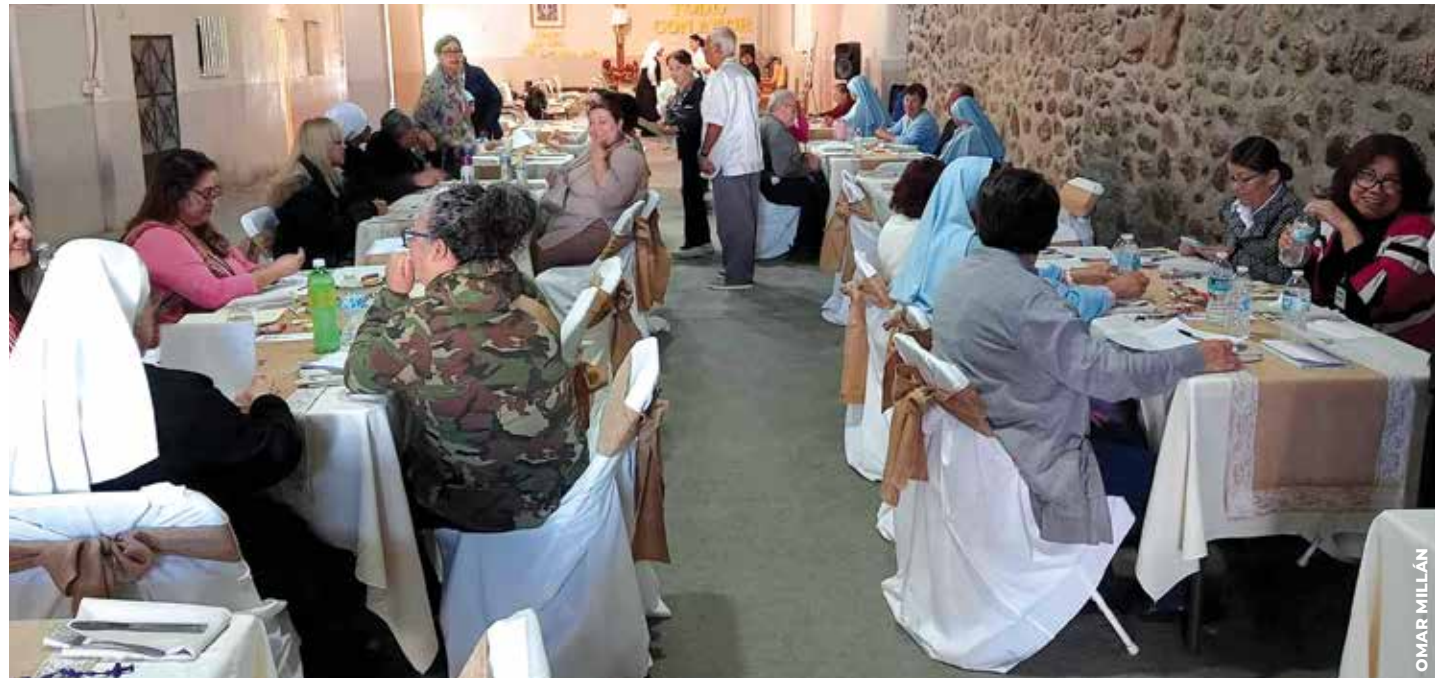
EMPATÍA: El obispo auxiliar Ramón Bejarano habló sobre la importancia de la justicia restaurativa en el primer foro binacional. Mencionó que para que una persona que está en prisión logre un verdadero cambio en su vida debe recibir profunda ayuda, no solo ser castigado.

Las mujeres eran participantes de un diálogo copatrocinado por la Arquidiócesis de Tijuana y la Diócesis de San Diego sobre justicia restaurativa. Fue el primer foro binacional a lo largo de la frontera entre Estados Unidos y México que utilizó un método desarrollado con el apoyo de la Diócesis de San Diego para reunir a tomadores de decisiones del sistema de justicia penal y a personas afectadas por dicho sistema para compartir sus experiencias.