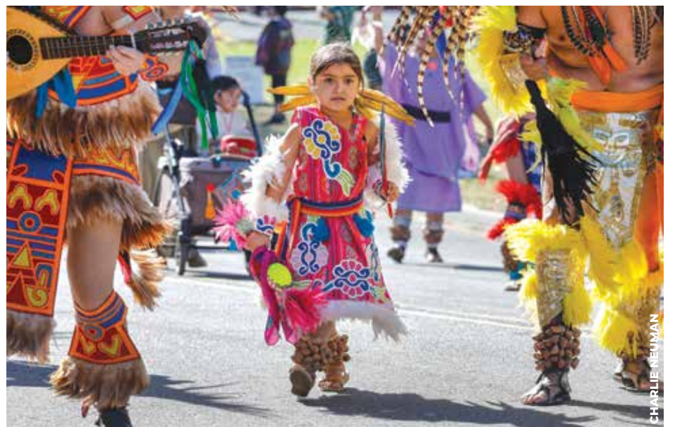
DULZURA: Esta pequeña danzante llamó la atención con su traje típico de plumas y ayoyotes.

Por su parte el obispo auxiliar Felipe Pulido dijo, “La Virgen nos une y mi esperanza es que algún día también participe gente de otras culturas para celebrar a la Virgen, que no solo es la Patrona de México, sino también de todas las Américas”.