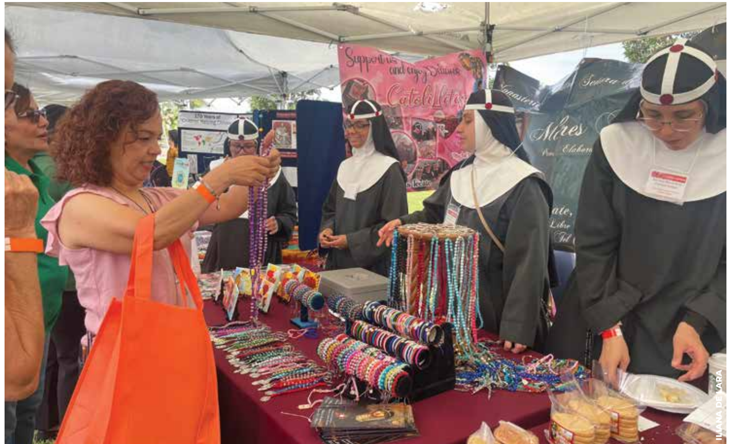
VENDIMIA: Al igual que el año pasado, al exterior del gimnasio se colocarán mesas de exhibición de diversos apostolados, órdenes religiosas, casas editoriales y algunos otros puestos de artículos religiosos.