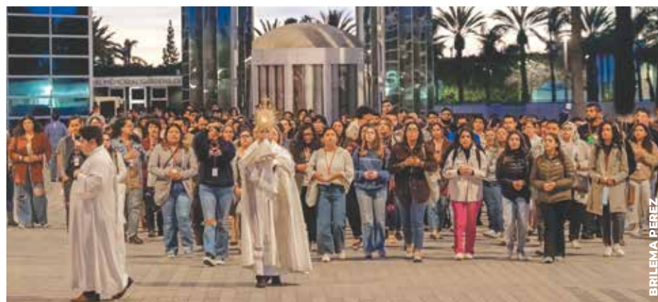
TRANSFORMADORA: La procesión es una de las actividades favoritas de los jóvenes adultos en el retiro “Siempre Antiguo, Siempre Nuevo”.

Mi Cuerpo”. Tema que está sustentado por tres “pilares”: alimentado, sanado y hecho nuevo.