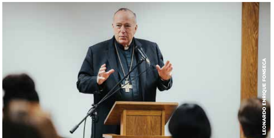
REUNIÓN DEL PERSONAL: El cardenal Robert McElroy anunció el 23 de febrero de 2023 en el Centro Pastoral que la diócesis estaba considerando la bancarrota.

Se desconoce cuánto tiempo llevará para que la diócesis, su compañía de