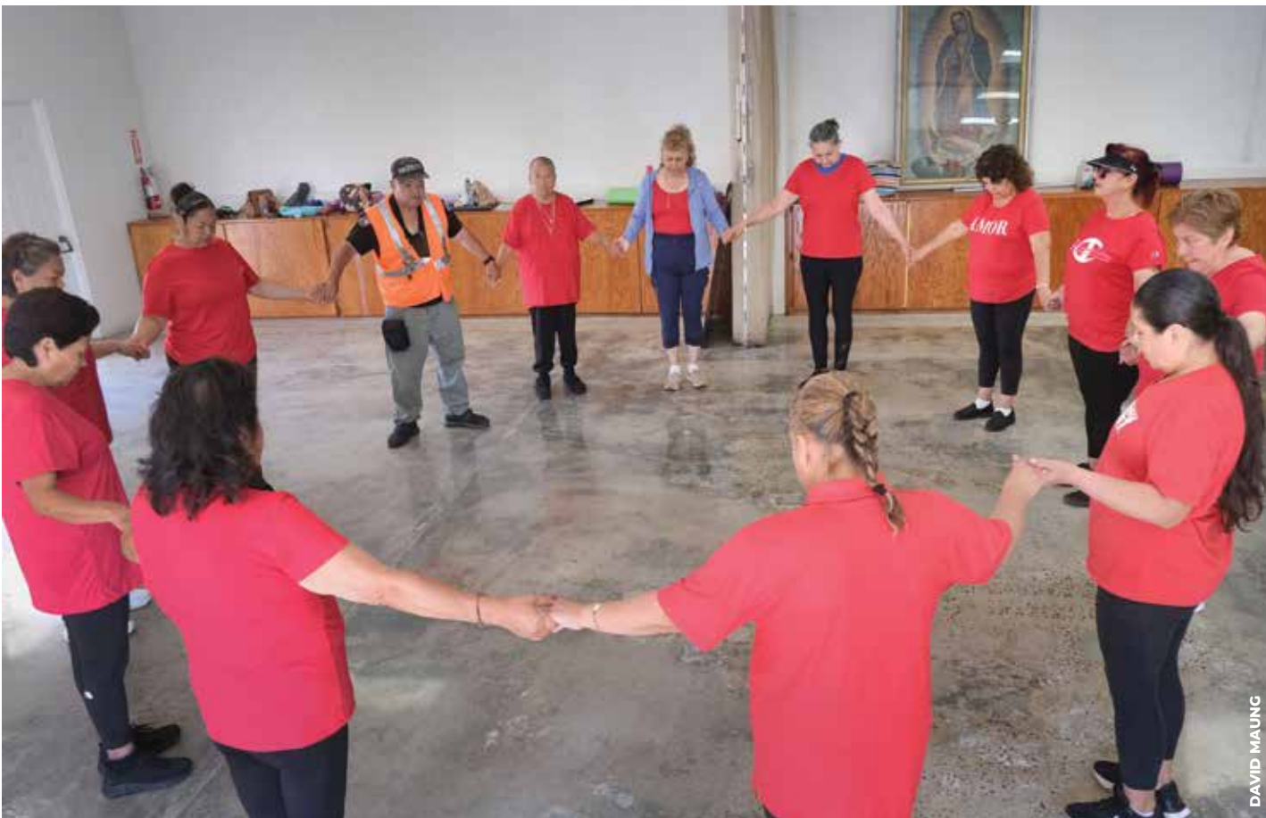
PRIMERO LO PRIMERO: Antes de dar inicio a la clase de ejercicio, el grupo de mujeres realiza una oración.