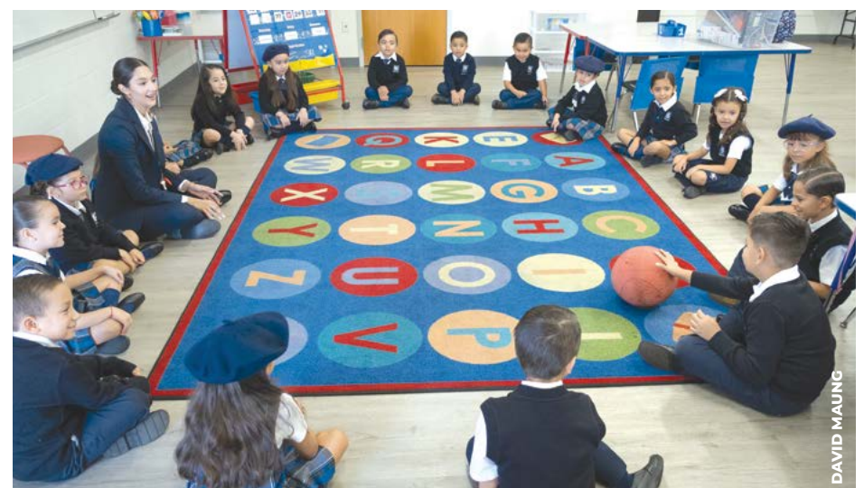
ROMPE HIELO: Durante el primer día los alumnos realizaron actividades de integración que los ayudaron a sentirse más cómodos y preparados para comenzar a aprender.